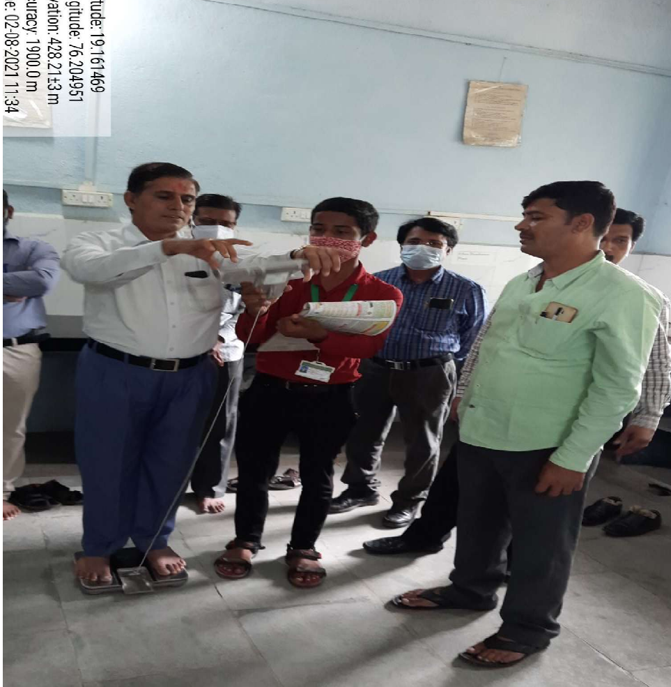
Photo Alo Health Care and Free Checkup Pune

Latitude: 19.161469 Longitude: 76.204951 Elevation: 428.21±3 m Accuracy: 1900.0 m Date: 02-08-2021 11:34