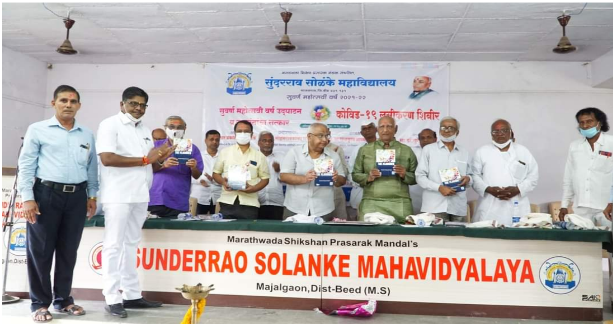
Vaccination Camp organized on 17 th August 2021 to 28 th August 2021