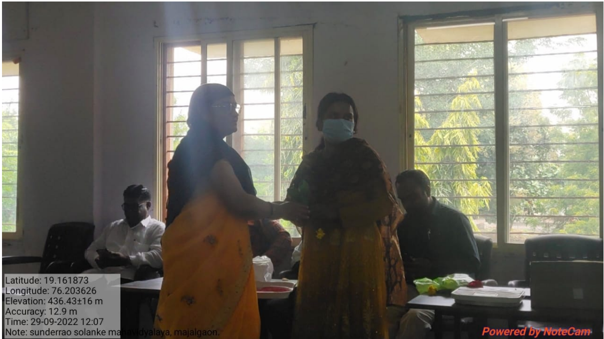
Mata Surakshit Ghar Surakshit organized by Gramin Rughalay Majalgaon.